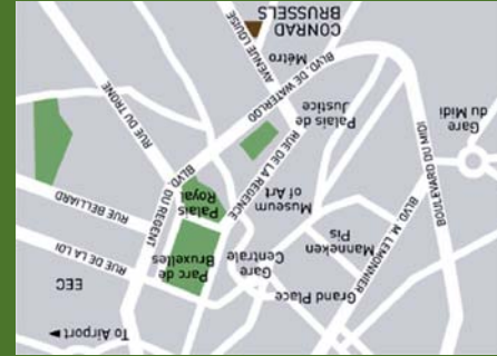
Plan d'accès | toegangspan

Exposants | Expositanten Andrian, Arunda, Josef Brigl, Productori Colterenzio, Erste + Neue, Franz Haas, Haderburg, Kellerei Kaltern, Kurtatsch - Cortaccia, H. Lentzsch, Manincor, K. Martini & Sohn, Lorenz Martini, Muri-Gries, Josef Niedermaier, Hans Rottensteiner, Castel Sallegg, Schmid Oberrautner, St. Michael/Eppan, Stachlburg, Terlan, Tiefenbrunner, Tramlin, Cantina Valle Isarco, Elena Walch, Josef Wegner, Peter Ziemmer